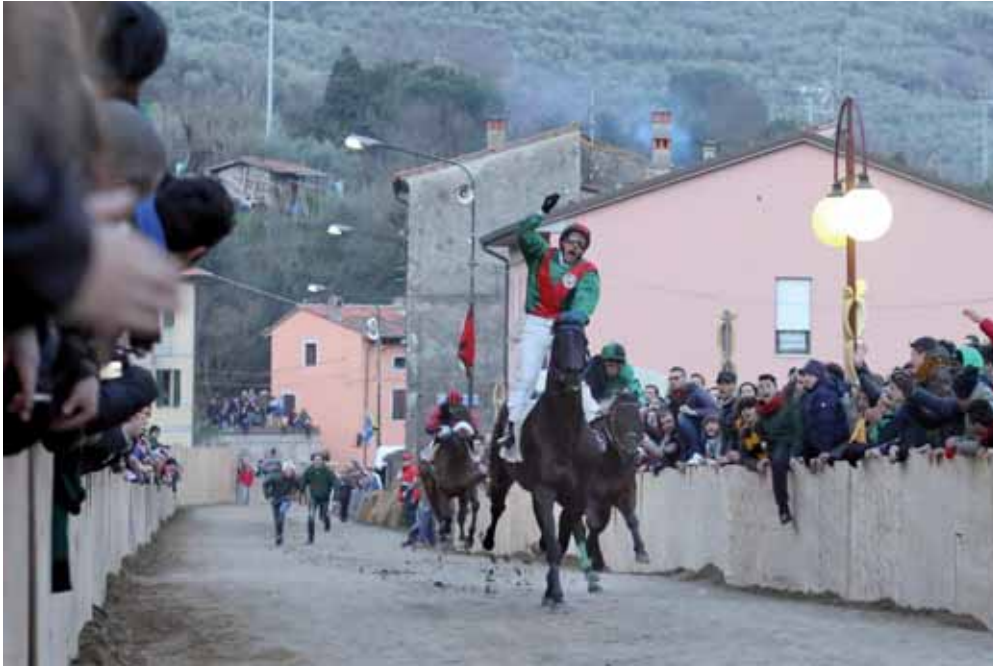
La Vittoria