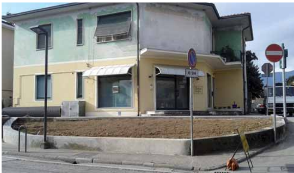
Angolo via Europa – Sarzanese Valdera

consigliere provinciale, ma fortunatamente abbiamo numerosi tecnici che sanno ben lavorare e che ringraziamo per aver realizzato con poche risorse questi interventi sul nostro territorio”.