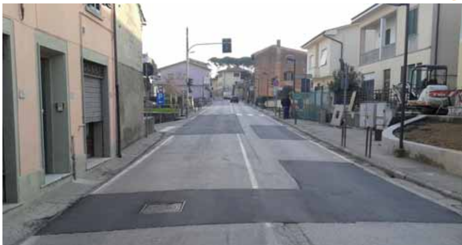
Via Sarzanese Valdera