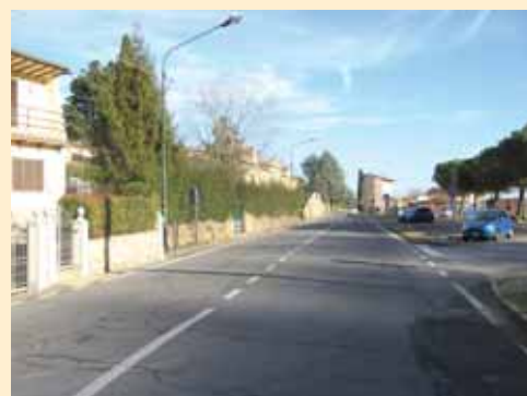
VIA GRAMSCI (CIMITERO)