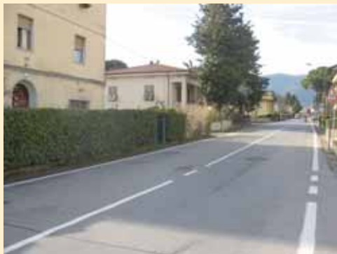
VIA MARTIRI DELLA LIBERTÀ