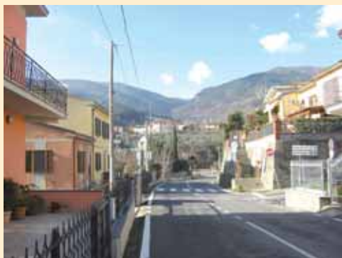
VIA S. GIUSEPPE